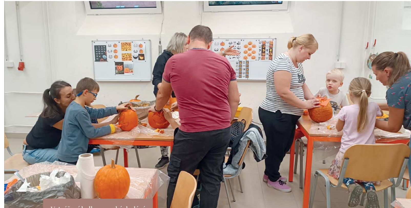
Vytváření halloweenských dýní