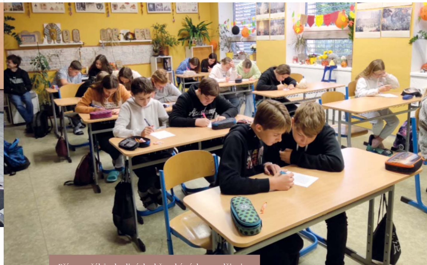
Přípravy žáků v hodinách občanské výchovy a dějepisu

Projektové vyučování „Od okupace ke svobodě“ jsme vytvořili ve spolupráci předmětových komisí Člověk a společnost a Český jazyk a umění.