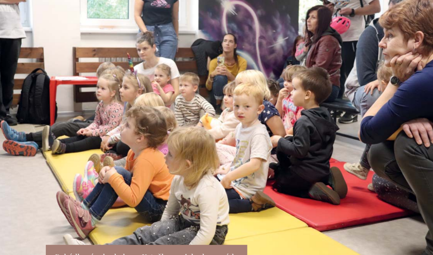
Pohádkové odpoledne s Krtečkem a jeho kamarády

Další akcí, která proběhla koncem října na Horizontu, bylo Pohádkové odpoledne s Krtečkem a jeho kamarády. Děti na začátku programu čekalo krátké divadlo o Krtečkovi, poté byla připravena různá stanoviště s úkoly např. najdi Krtečkovi cestu do krtince, skákej po leknínech jako žabička aj. Za splnění úkol dostaly děti razítka a následně si vybraly odměny. Ke konci programu měly děti mini diskotéku.