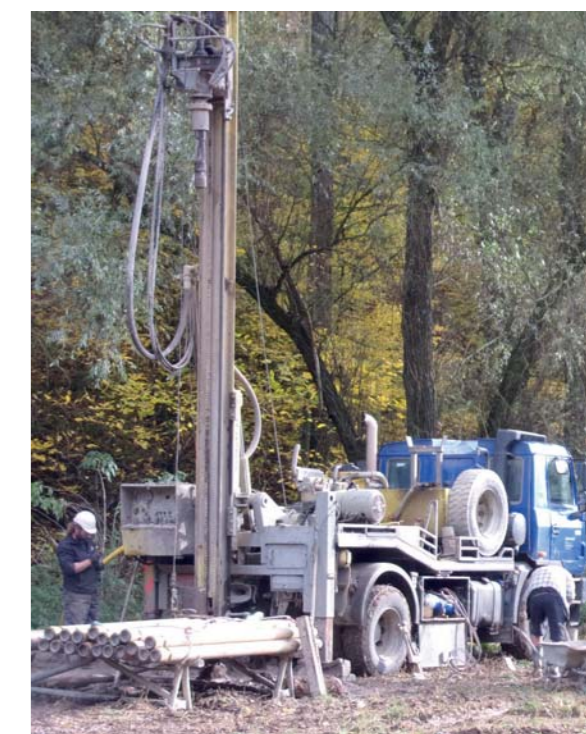
Pětadvacetimetrová vrтанá sonda do podzemního prameniště vody u Padochova

v současnosti dost. Avšak na obecně vysušené jižní Moravě je jí málo, proto se propojují vodárenské soustavy k vzájemné výpomoci pitnou vodou. Třeba z Ivančicka na Třebíčsko a výhledově i do Vířského oblastního vodovodu,“ informoval Aldorf.