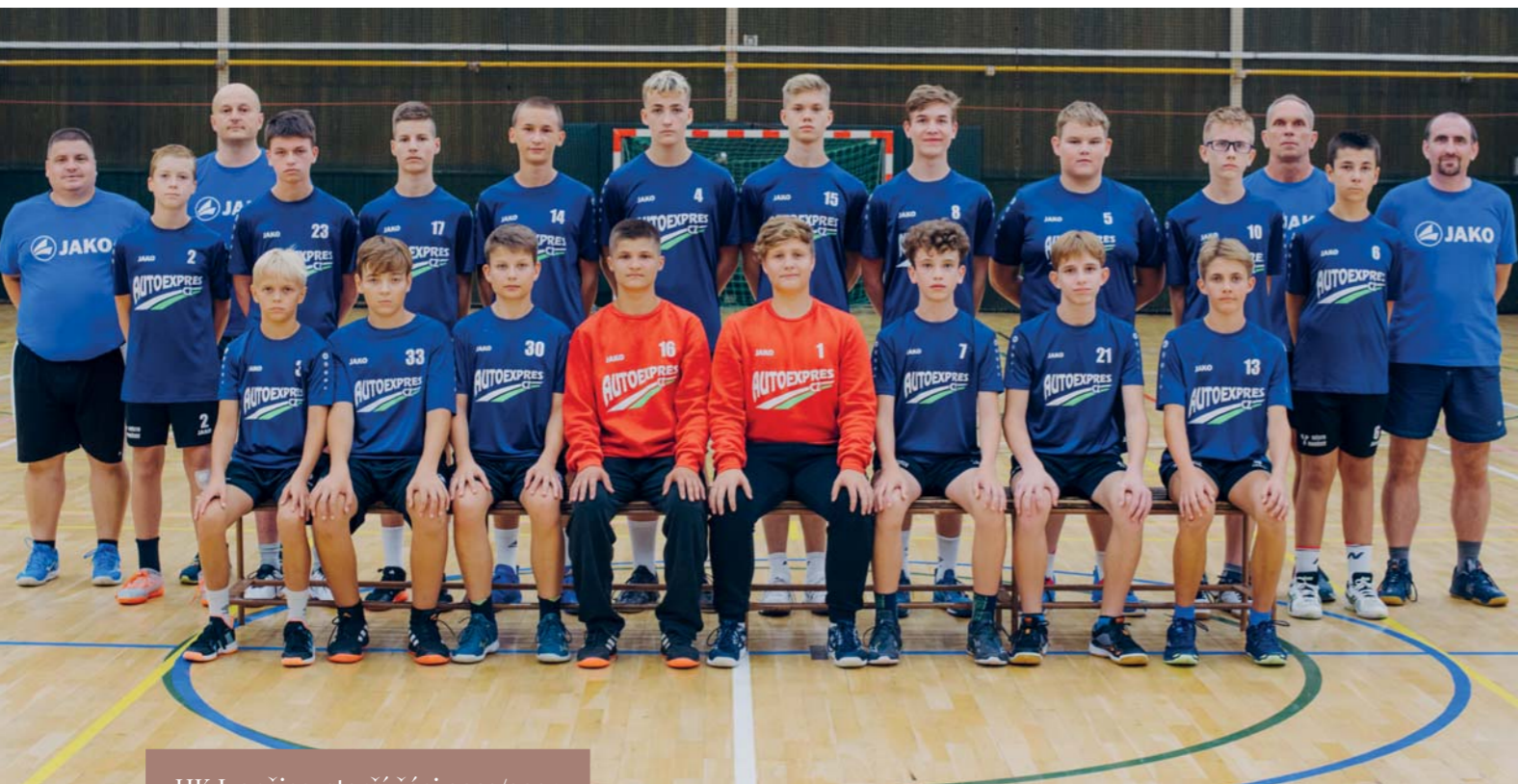
HK Ivančice, starší žáci 2023/2024