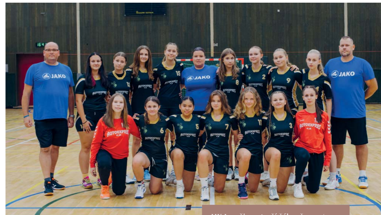
HK Ivančice, starší žákyně 2023/2024