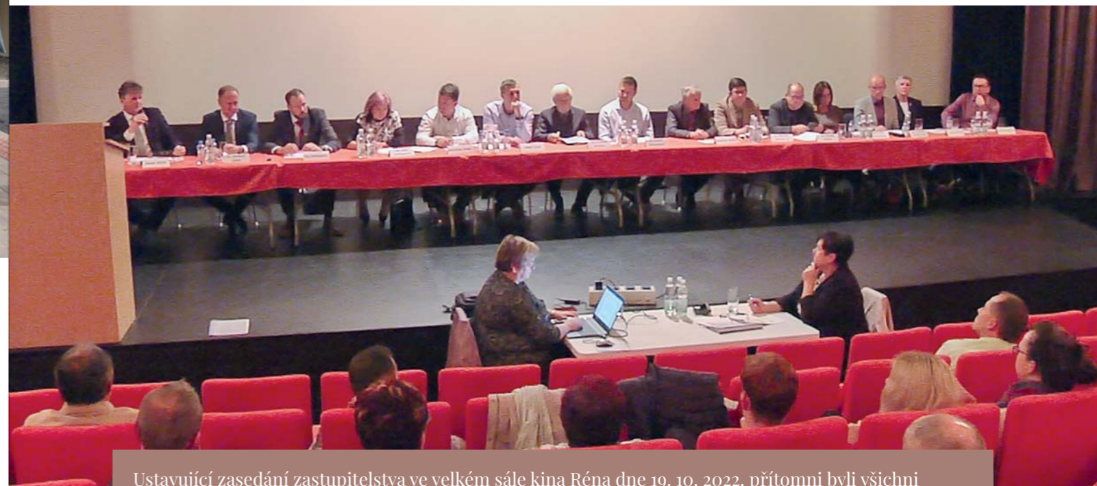
Ustavující zasedání zastupitelstva ve velkém sále kina Réna dne 19. 10. 2022, přítomni byli všichni zastupitelé

Zastupitelstvo města se ve sledovaném období sešlo třikrát, a to dne 19. 10., 1. 11. a 14. 11. Stručně přinášíme výběr z některých usnesení zastupitelstva.