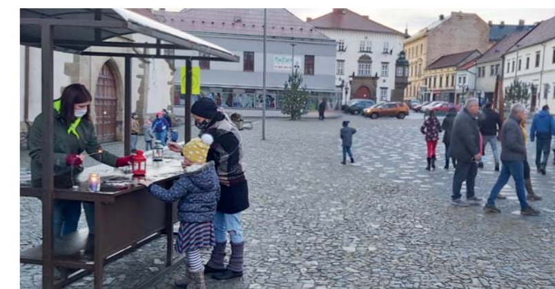
Rozdávání betlémského světla na Palackého náměstí také letos proběhne na Štědrý den od 15 do 17 hodin