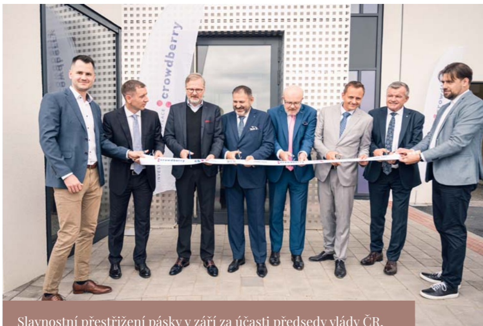
Slavnostní přestřižení pásky v září za účasti předsedy vlády ČR, ministra zdravotnictví a dalších významných osobností

Ivančický domov seniorů vznikl za podpory soukromých investic.