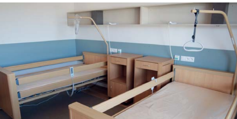
Ukázka typického dvoulůžkového pokoje

Na závěr nutno dodat, že se domov stane v Ivančicích také významným zaměstnavatelem. V současné době hledá spolupracovníky, kteří se stanou součástí motivovaného a příjemného kolektivu. Uplatnění zde mohou najít především profese jako zdravotní sestry, pečovatelské, fyzioterapeutky, pedikérky, masérky.