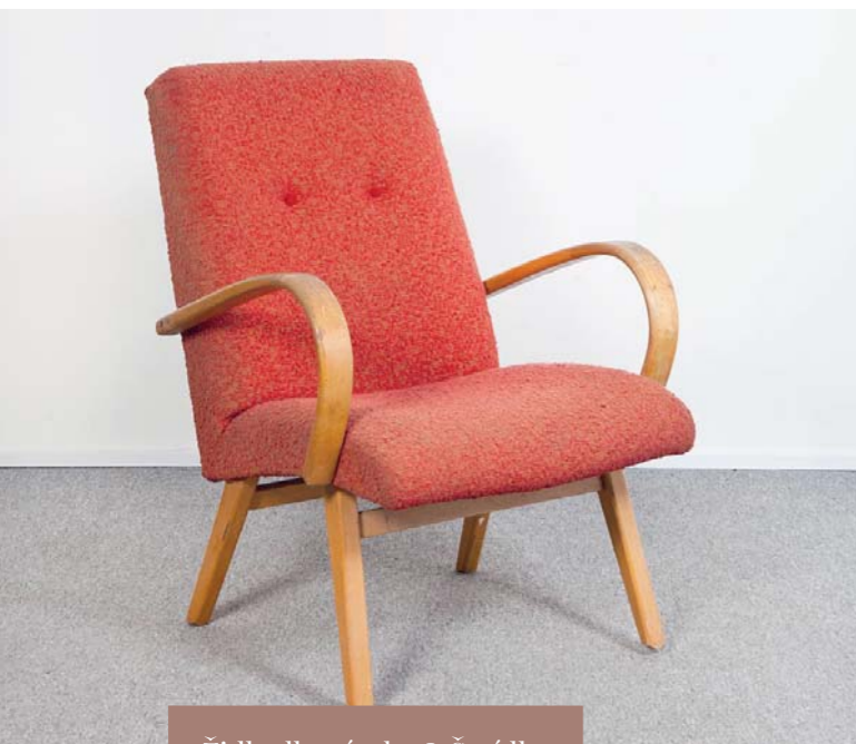
Židle dle návrhu J. Šmídka

rekonstrukci sociálního zařízení, další změny byly spíše technického charakteru: v roce 2012 bylo kino digitalizováno, v roce 2019 byl nainstalován 3D aktivní stereo systém DCI.