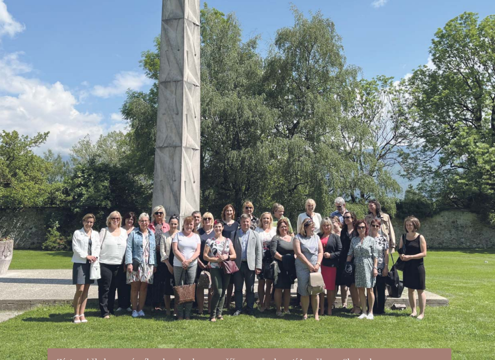
Zástupci škol ze správního obvodu obce s rozšířenou působností Ivančice ve Slovinsku