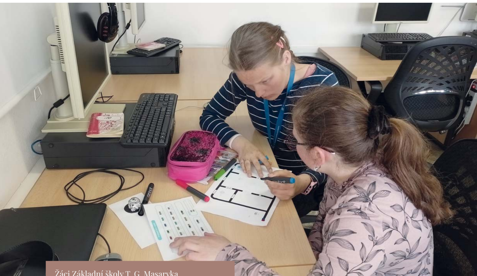
Žáci Základní školy T. G. Masaryka v Ivančicích při výuce informatiky