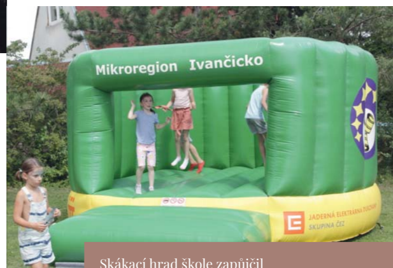
Skákací hrad školy zapůjčil Mikroregion Ivančicko