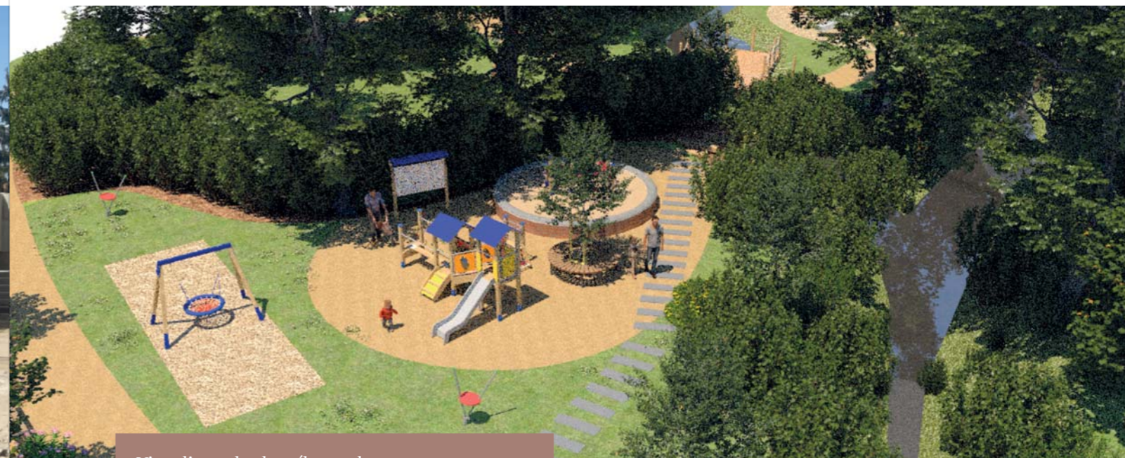
Vizualizace budoucího parku