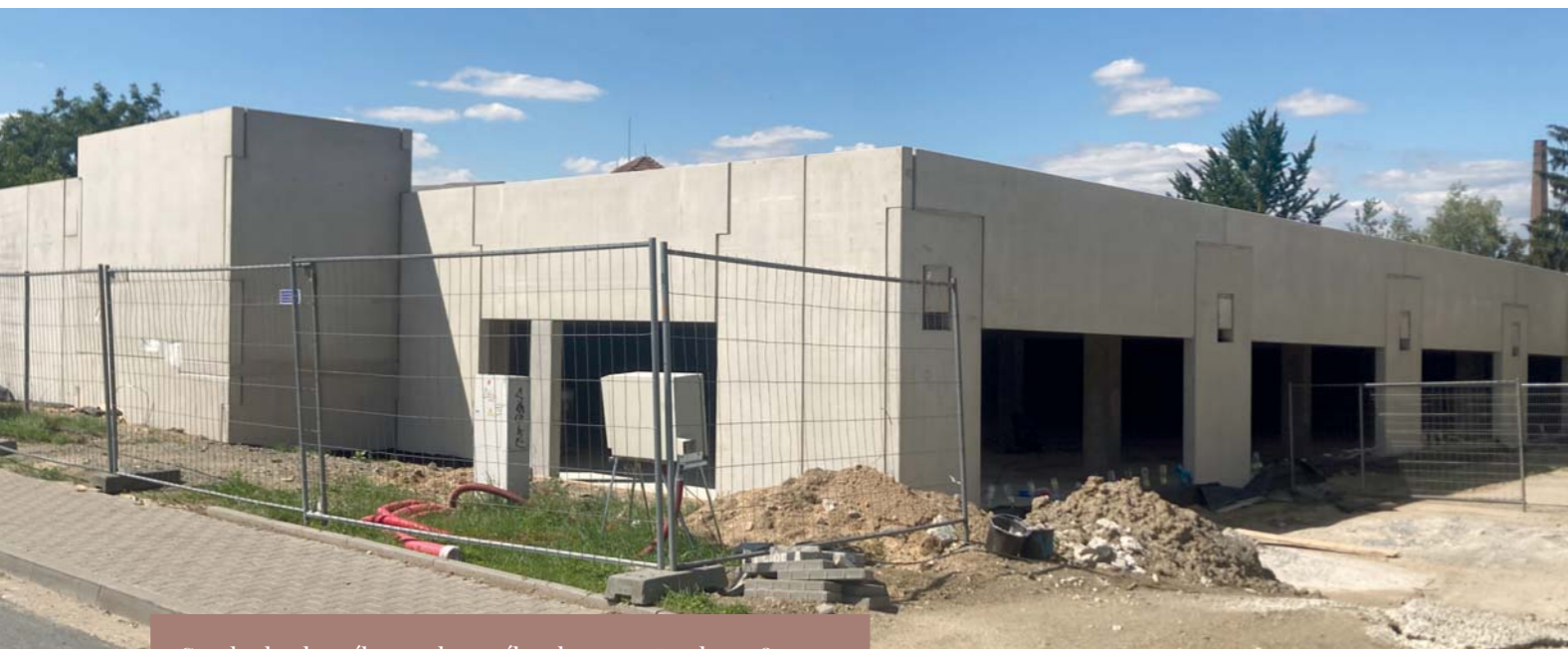
Stavba budoucího parkovacího domu – stav k 10. 8. 2022