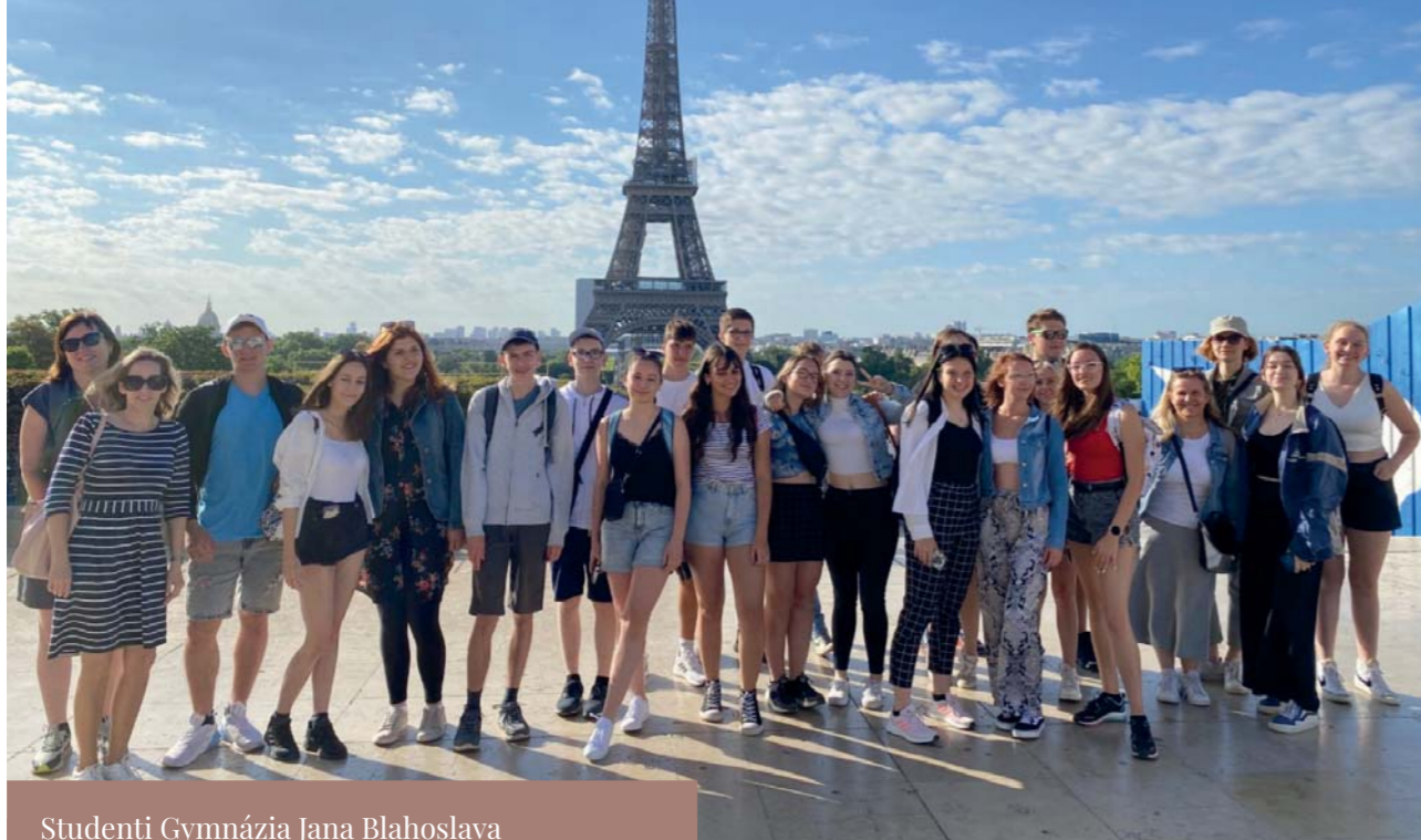
Studenti Gymnázia Jana Blahoslava na návštěvě Paříže