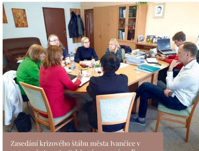
Zasedání krizového štábu města Ivančice v pracovně starosty. Schůze jsou nyní podle situace svolávány i několikrát do týdne.