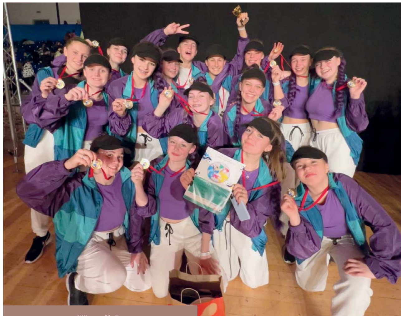
TAD crew na soutěži ve Zlíně

V sobotu 19. 3. zahájila taneční skupina TAD crew svoje soutěžní nasazení v jarním sezóně. Jejich první soutěž Tancer cup byla odtančena v Baťově městě Zlín, kde byli opět úspěšní.