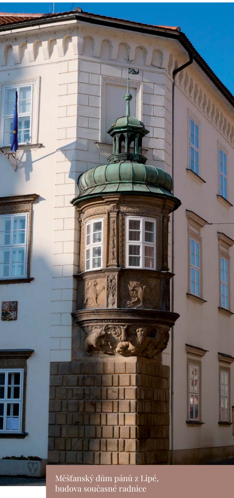
Městský dům pánů z Lipé, budova současné radnice