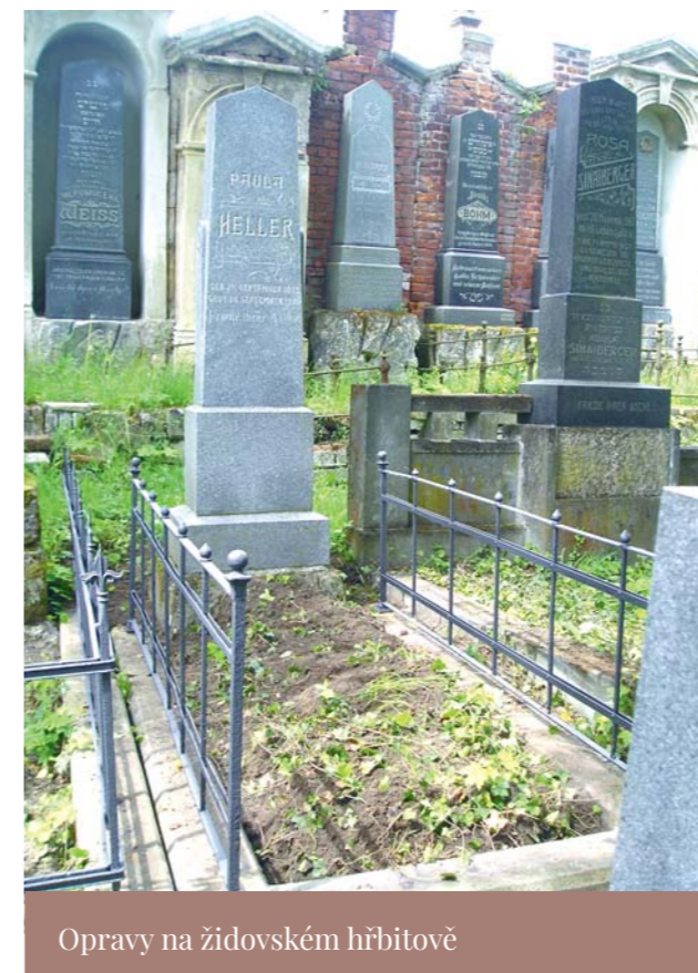
Opravy na židovském hřbitově