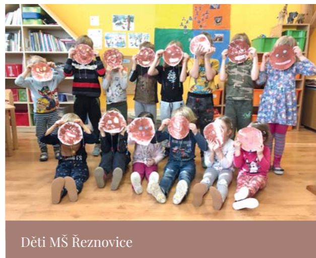
Děti MŠ Řeznovice

Vyprávění pohádek patří k našim národním tradicím, a ty se u nás ve školce snažíme dodržovat. Pohádky děti vypráví každý den při odpočívání po obědě. Vyprávět před ostatními se ale neodváží každý. Je důležité mluvit nahlas, srozumitelně a podle osnovy. Tu si někdy děti přizpůsobují a my jsme svědky nových verzí pohádek. Na základě znalosti původní verze pohádky si mohou dovolit upravit některé části příběhu, a přitom musí dodržet kouzlo i pointu pohádky. Jako posluchači to oceňujeme. Vyprávění má svoji originalitu a vtip (často neopakovatelný). Vypravěči bývají nejčastěji předškoláci a mladší děti jsou nejprve jen pozornými posluchači. Postupně, po vzoru svých starších kamarádů, nabírají odvalu a stávají se také skvělými vypravěči. Každý z nás vynikáme v něčem jiném, i děti se učí znát své silné stránky. A proto vypravěčem pohádek nebývají všechny děti. Některé to alespoň zkusí (samy nebo s nápovědou ostatních) a podle úspěšnosti se dál rozhodují. Jiné bývají jen spokojenými posluchači. A které pohádky jsou u nás mezi vypravěči nejoblíbenější? Vedou Tři prasátka, Neposlušná kůzlátka, Červená Karkulka, Perníková chaloupka, Koblížek, O veliké řepě.