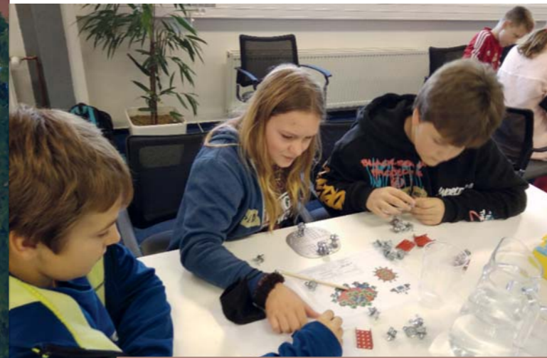
Kreativní činnost dětí ZŠ Němčice

Škola je od 1. 9. 2021 zapojena do projektu hrazeného z dotace Operačního programu věda, výzkum vzdělávání, Šablony III. Tento projekt přináší pro vzdělávání ve škole zejména aktivity, které mají žákům rozšířit obzory v mnoha směrech.