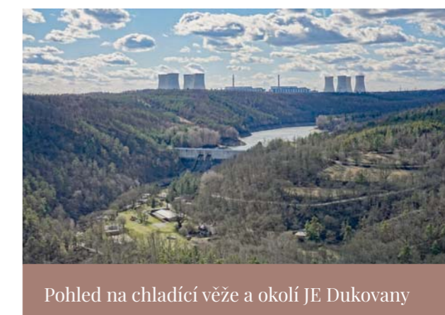
Pohled na chladičí věže a okolí JE Dukovany

V našem regionu mohou lidé kromě jaderné elektrárny Dukovany opět navštívit také vodní elektrárnu Dalešice. Zájemci o exkurze se mohou přihlašovat prostřednictvím e-mailu nebo telefonicky, vše potřebné najdou na www.cez.cz/ infocentra. Ročně navštíví elektrárny ČEZ více