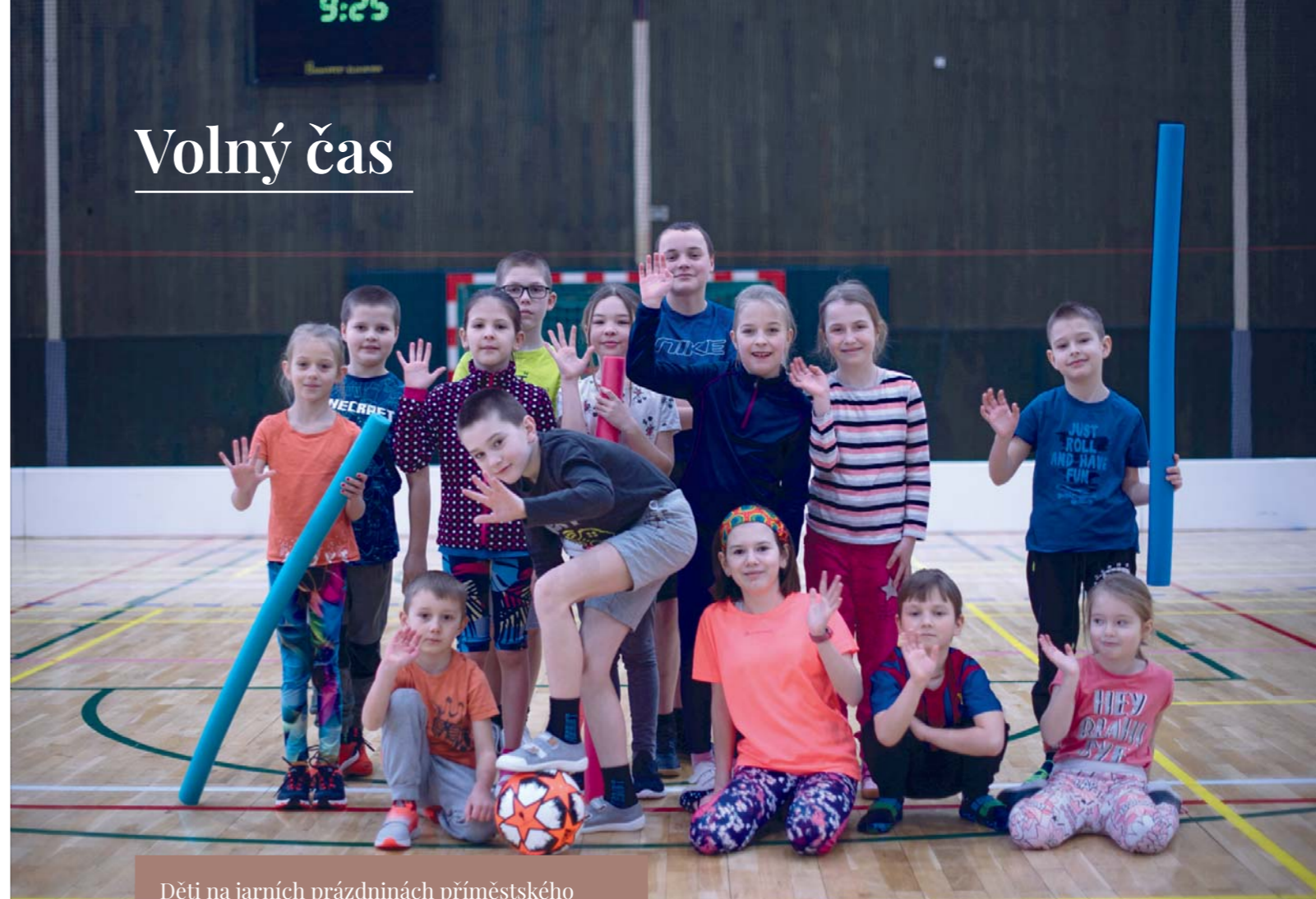
Děti na jarních prázdninách příměstského tábora ve sportovní hale