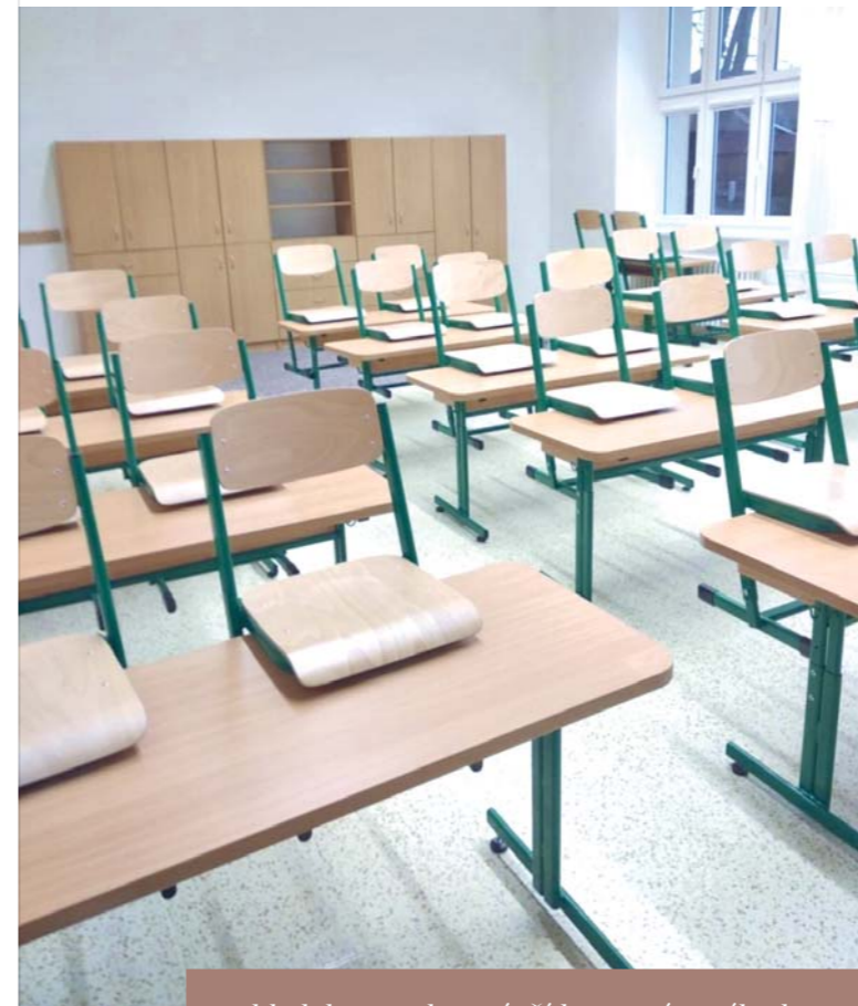
Pohled do vymalované třídy s novým nábytkem

V době jarních prázdnin se na ZŠ TGM rekonstruovalo. Nových podlah a vymalování se dočkaly čtyři třídy na 1. stupni.