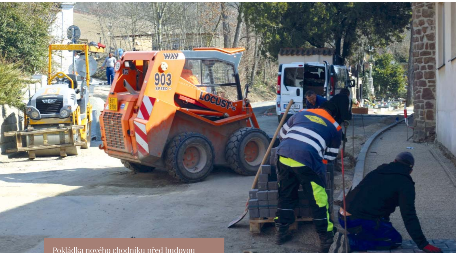
Pokládka nového chodníku před budovou obřadní smuteční síně