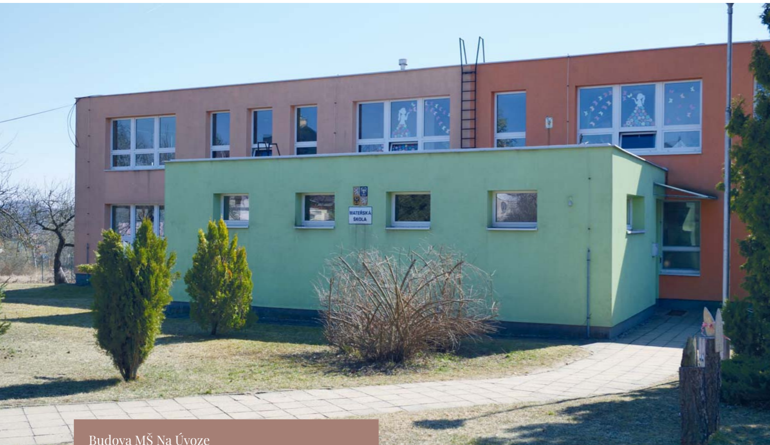
Budova MŠ Na Úvoze – zde je plánována přístavba