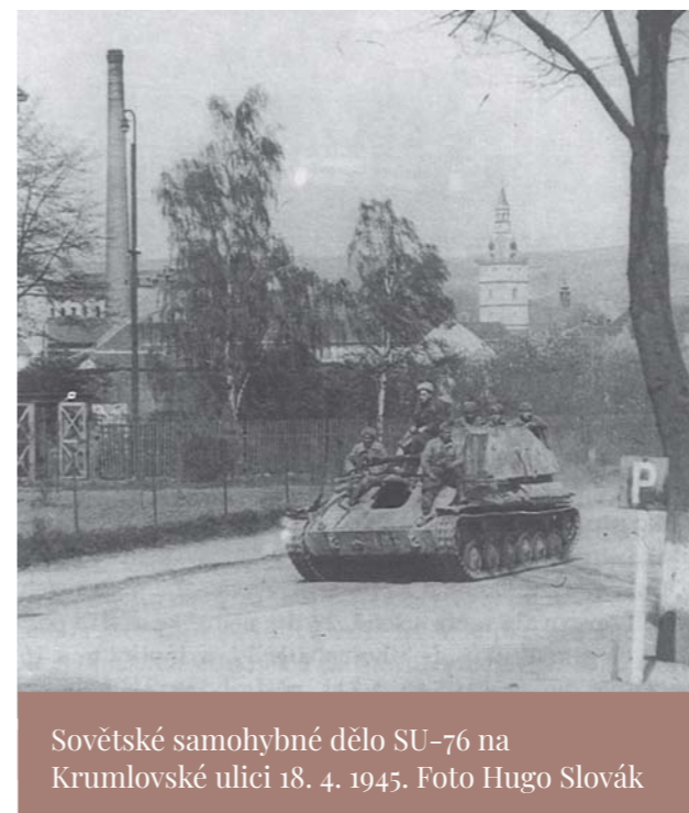
Sovětské samohybné dělo SU-76 na Krumlovské ulici 18. 4. 1945.

Na počátku dubna 1945 začala vojska 2. ukrajinského frontu maršála R. J. Malinovského druhou fázi bratislavsko-brněnské operace.